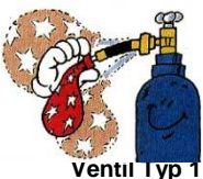
Ventil Typ 1